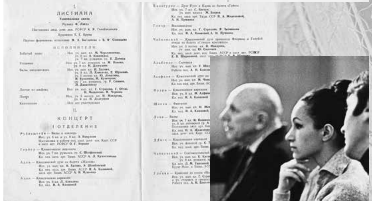
Программка выпускного спектакля 29 июня 1958 года