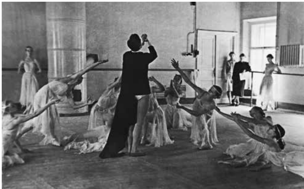
Репетиция «Листианы». В центре – Никита Долгушин. 1958 год