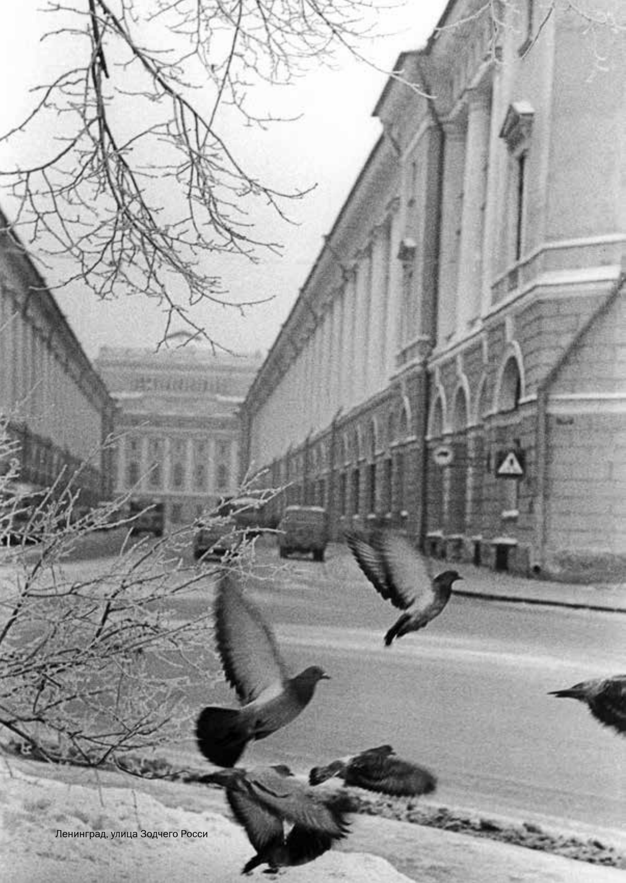
Ленинград, улица Зодчего Росси